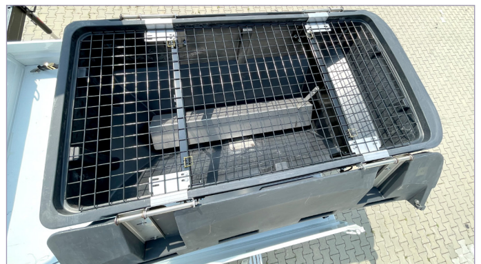
Förderschnecke mit Abdeckung