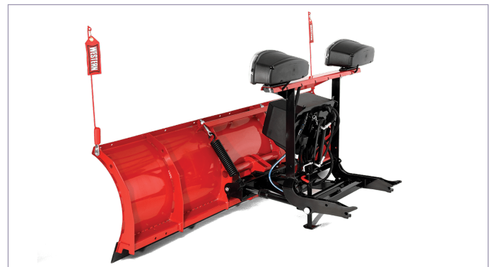
Bodenfreiheit durch Schnellanbausystem